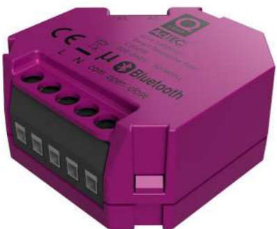
SMART PERSIENNE El-nr.: 1400510

Smart Rele er en bryteraktuator med innebygd Bluetooth-enhet som kommuniserer trådløst via smarttelefon og APP. Den gir mulighet for å styre ulike elektriske apparater opptil max.belastning 2300W. Smart Rele har potensialfri inngang for tilkobling av impulsbrytere og lokal betjening. Beregnet for skjult montering i veggboкс.