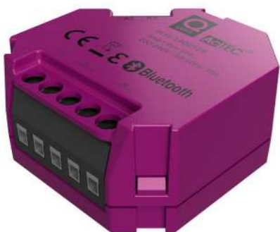
SMART RELE 10A El-nr.: 1400509

Smart Puck 1-10V er en bryteraktuator med innebygd Bluetooth-enhet som kommuniserer trådløst via smarttelefon og APP. Den gir mulighet for å styre belysning med 1-10V driver. Smart Puck 1-10V har potensialfri inngang for tilkobling av impulsbrytere og lokal betjening. Beregnet for skjult montering i veggboкс.