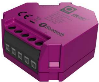
SMART PUCK 1-10V El-nr.: 1400511

Smart Puck 1-10V er en bryteraktuator med innebygd Bluetooth-enhet som kommuniserer trådløst via smarttelefon og APP. Den gir mulighet for å styre belysning med 1-10V driver. Smart Puck 1-10V har potensialfri inngang for tilkobling av impulsbrytere og lokal betjening. Beregnet for skjult montering i veggboкс.